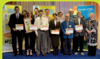
Les gagnants du prix 2006 : Bristol (GB) - 1 er , Brasov (RO) - 2 e , Lille (FR) - 3 e et mention spéciale à Lausanne (CH).

La cérémonie de remise de prix se déroulera en automne 2007.