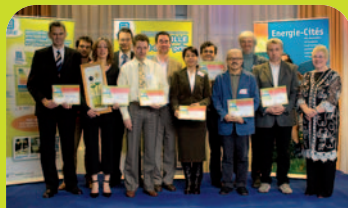
The 2006 Award winners:

The award ceremony will take place in autumn 2007.