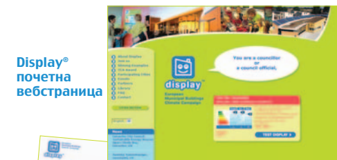
Display® почетна вебстраница