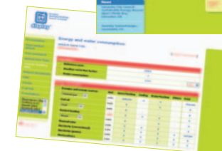
Алатка за пресметки

Тестирајте го Display® и објавете го вашиот постер на www.display-campaign.org