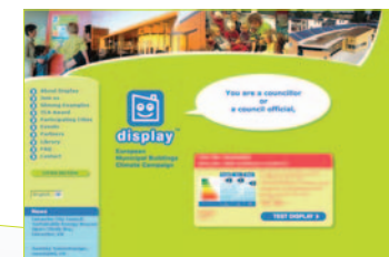
Сторінка Display™ в Інтернеті